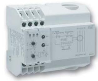
Differenzstromwächter IR 5882