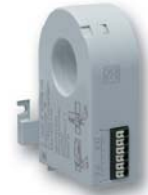
Différentiel intégré ND 5015