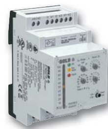
Contrôleur de courant différentiel RN 5883