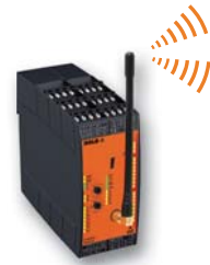
Funk-Sicherheitsmodul UH 6900 Gruppensteuergerät