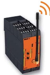
Funk-Sicherheitsmodul UH 6900