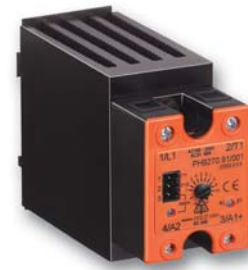
Halbleiterschütz PH 9270