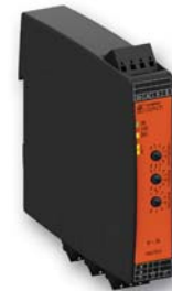
1-phasiger intelligenter Motorstarter UG 9411