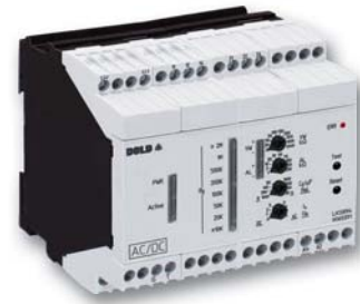
Isolationswächter LK 5894