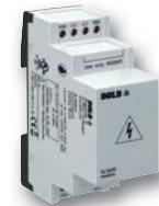
Vorschaltgerät RL 5898