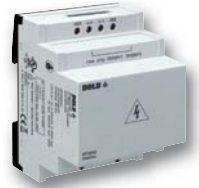
Vorschaltgerät RP 5898