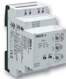
Isolationswächter RN 5897/300