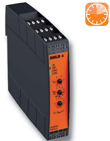
SAFEMASTER C - UG 6960 sichere Zeit- und Sicherheitsfunktionen realisierbar