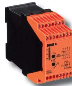
Stillstandswächter LH 5946

Kat. 4 / PL e nach DIN EN ISO 13849-1 SIL CL 3 nach IEC/EN 62061 SIL 3 nach IEC/EN 61508, IEC/EN 61511 und EN 61800-5-2