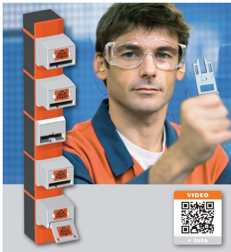
Sicherheitsschalter- und Schlüsseltransfersystem SAFEMASTER STS schützt durch Persönlichen Schlüssel vor Einspernungen (mit QR-Code für Video)

Es gibt verschiedene Optionen, für sichere Fluchtmöglichkeiten aus Gefahrenbereichen zu sorgen. Vorteilhaft sind jedoch Sicherheitskonzepte, die auf vorbeugenden Schutzmaßnahmen basieren. Das heißt, einem Einsperren von Personen in Gefahrenbereichen wird bereits im Vorfeld sicher vorgebeugt. Zusätzlich wird ein Maschinenanlauf sicher verhindert, solange sich darin Personen befinden. Deshalb kann ein Sicherheitssystem mit Persönlichem Schlüssel in vielen Fällen als ideale Lösung angesehen werden.