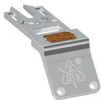
Persönlicher Schlüssel mit Codierung

Bei der Abwägung, ob nun „Persönlicher Schlüssel“ oder „Fluchtentriegelung“ der bessere Einsperrschutz für eine bestimmte Applikation ist, sind verschiedene Kriterien zu berücksichtigen. Die sicherere Variante der beiden Möglichkeiten ist der Persönliche Schlüssel. Wie bereits erwähnt, bietet die Fluchtentriegelung nur dann einen ausreichenden Einsperrschutz, wenn die Fluchttür im Falle einer Einsperrung jederzeit rechtzeitig erreichbar ist. Bei einer mit Fluchtentriegelung ausgestatteten Standard-Zuhaltung kann die Schutztür von Unbefugten jederzeit verriegelt und die Maschine wieder gestartet werden. Befinden sich dabei gerade Personen im Gefahrenbereich könnte das schwerwiegende Folgen haben. Um dies sicher zu verhindern, sind zusätzliche Schutzmaßnahmen erforderlich. Meistens wird das Problem mit willensabhängigen LOTO-Maßnahmen (Lock out Tag out) gelöst. Bei manchen Anwendungen sind Fluchtentriegelungen aus technischen Gründen nicht umsetzbar, da sich die Bedienelemente der Fluchtentriegelung nicht auf der Gefahrenseite anbringen lassen. Das können beispielsweise Behälter, Mischer, Presskammern oder auch enge Maschinenräume sein. Der Persönliche Schlüssel ist hierfür als vorbeugende Schutzmaßnahme gegen Einsperrung und Wiederanlauf einer Maschine die ideale Lösung.