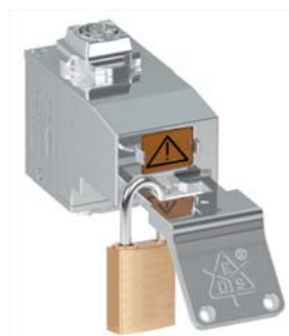
Vorhängeschlossmodul zur Einbindung von LOTO-Funktionen in SAFEMASTER STS - System