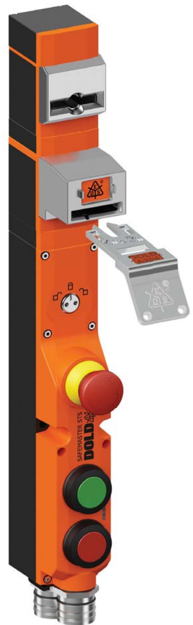
SAFEMASTER STS ZRH C Einheit mit Schlüssel

Das Sicherheitsschalter- und Schlüsseltransfersystem SAFEMASTER STS von Dold & Söhne erfüllt alle Anforderungen der aktuellen Maschinenrichtlinie. So ist auch der Persönliche Schlüssel integraler Bestandteil des vom TÜV zertifizierten Sicherheitssystems. Im Gegensatz zu LOTO erfolgt der Einsperrschutz bei diesem nicht nur optional, sondern wird erzwungen. Das heißt, erst nach Entnahme des Persönlichen Schlüssels lässt sich die Schutztür öffnen und der Gefahrenbereich betreten. Das System beinhaltet auch Einheiten, in welche mehrere Schlüssel integriert werden können, damit mehrere Personen einen eigenen Schlüssel zur Verfügung haben